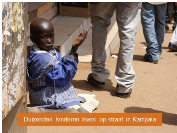
Duizenden kinderen leven op straat in Kampala

Drie Oegandese partnerorganisaties van Kerk in Actie werken samen met de kinderen aan een beter bestaan, met familie, een dak boven hun hoofd en vooral: op school. Als ze dat willen, begeleiden de organisaties jonge moeders en kinderen terug naar hun geboortedorp, waar de kansen op een beter bestaan zijn toegenomen.